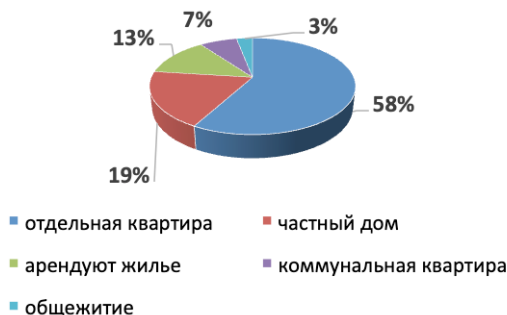
Рисунок 4 – «Жилищный» вопрос

вий их проживания; 3% семей проживают в семейных общежитиях, что на наш взгляд отрицательно влияет на самочувствии членов семьи.