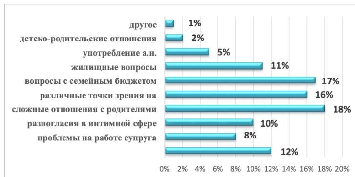
Рисунок 2 – Причины разногласий

ми одного или обоих супругов, что отрицательно сказывается на взаимоотношениях между супругами. Также 16% и 17% опрошенных соответственно имеют различные точки зрения в воспитании детей и разногласия в связи с вопросами, затрагивающими семейный бюджет.