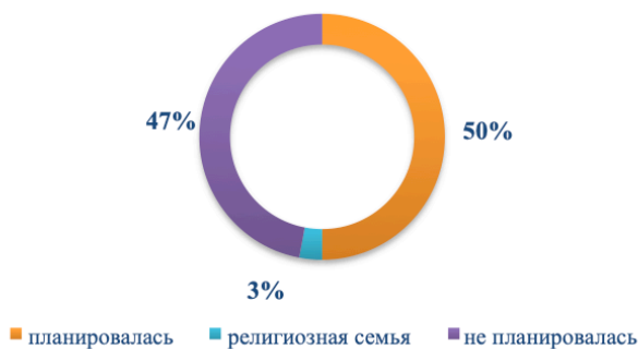
Рисунок 1 - Планирование многодетности

Опрошенные нами многодетные семьи распределились следующим образом (рис. 1). 50% семей изначально с создания супружеской пары планировали многодетность. 3% опрошенных являются семьями с религиозными взглядами, где данный вопрос не обсуждается, поскольку многодетность есть норма. А вот семьи, где многодетность не планировалась, составило 47% из общего числа опрошенных.