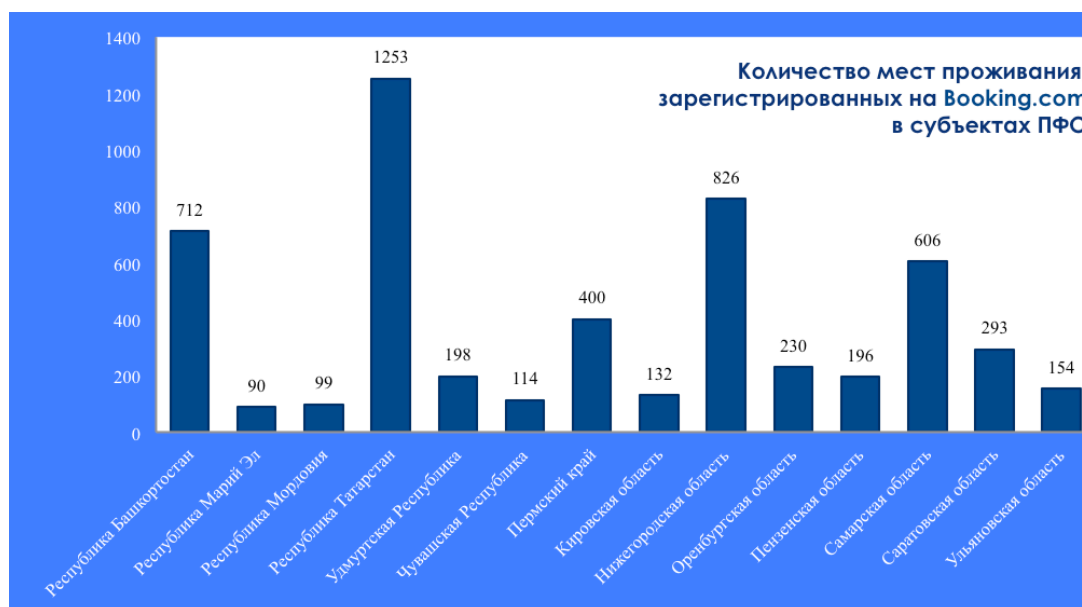
Рис. 2. Количество мест проживания, зарегистрированных на Booking.com в субъектах ПФО на 1.10.2017.

Однако же, на наш взгляд, более релевантным будет обратиться к данным популярнейшего интернет-сайта Booking.com. Данный сайт, основанный в 1996 году, сейчас имеет версии на 43 языках и включает в себя 1 473 707 вариантов размещения по 121 164 направлениям в 228 странах и территориях по всему миру. В качестве арендодателя апартаментов/отельера/владельца хостела и т.д. подписать контракт с сайтом может практически любой человек, желающий заняться гостиничным бизнесом [1]. То есть здесь мы можем получить более реалистичную картину развития частного предпринимательства в данной сфере, причем с минимальными входными барьерами. Эти данные дополняют картину Росстата и показывают нам реальное число мест, где могут остановиться туристы. Данные сайта Booking.com. на 1 октября 2017 года позволяют увидеть в ПФО следующую картину (Рис. 2).