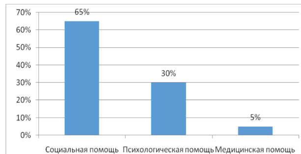
Рисунок 2. Показатели необходимости помощи.

Анализ ответов испытуемых позволяет также отметить, что 65% вышедших на волю заключенных нуждаются, в основном, в социальной помощи, на оказание психологической помощи указывают 30% опрошенных, медицинской – 5% (Рис.2).