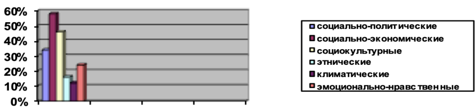
Рисунок 2 – Распределение ответов экспертов на вопрос: «Какие факторы, по Вашему мнению, детерминируют качество жизни замещающих семей в настоящее время?»